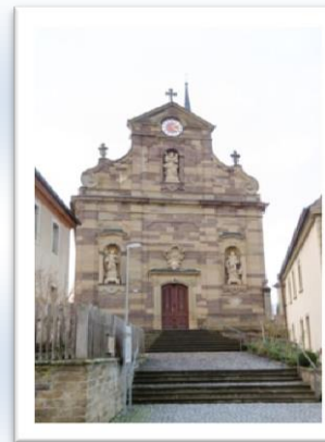
Start: Kirche Egenhausen

Schalom bedeutet weit mehr als nur Frieden: Gesundheit, Wohlergehen, Heil, Glück, Ganzheit, Harmonie, einen Zustand, der keine unerfüllten Wünsche offen lässt, und Gottvertrauen. In diesem Vertrauen pilgern wir.